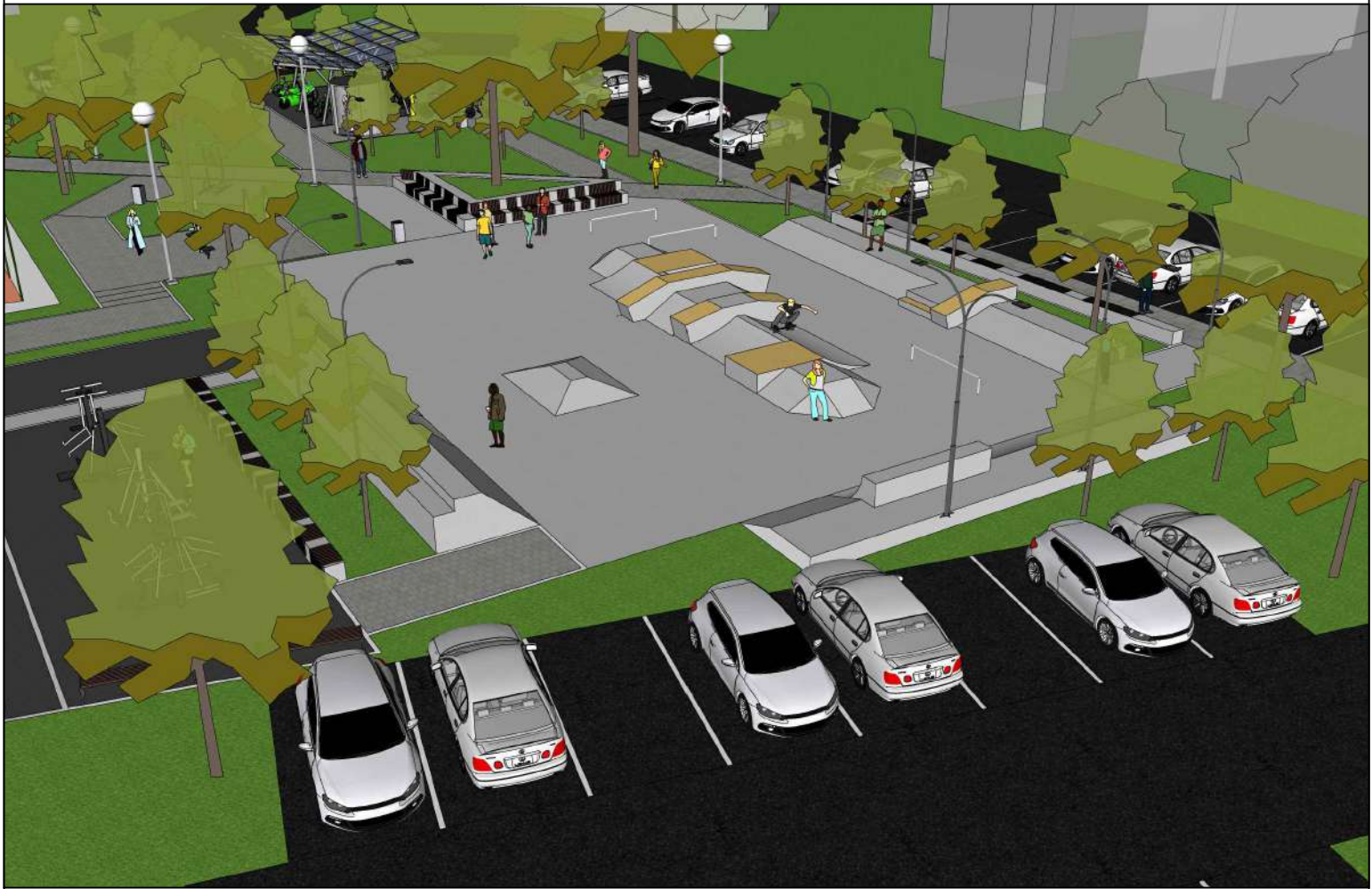
wizualizacja całego założenia od strony istniejącego parkingu