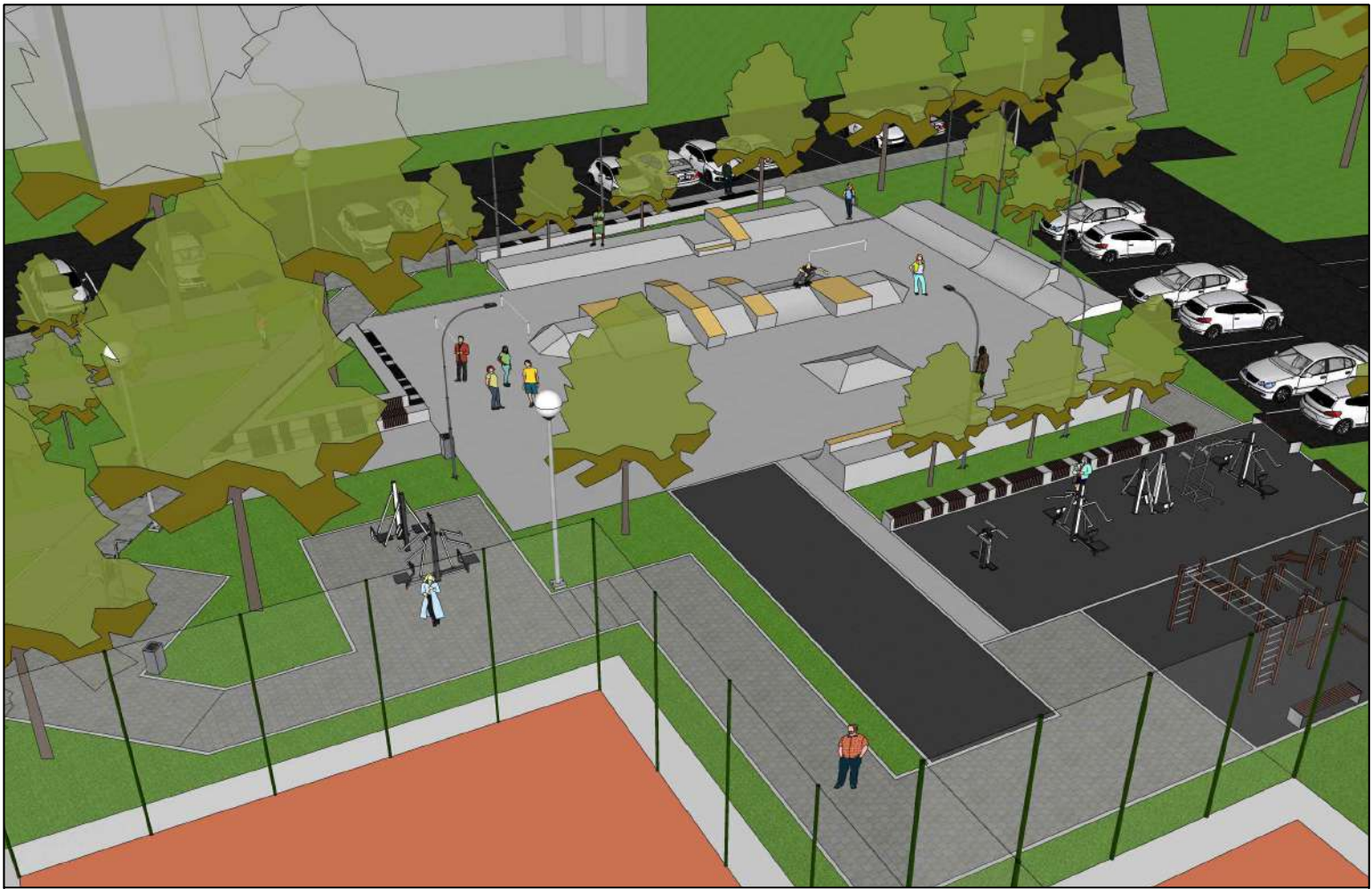
wizualizacja całego założenia od strony istniejących boisk