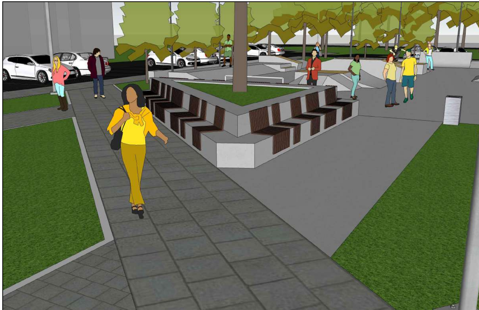
wizualizacja miejsca spotkań