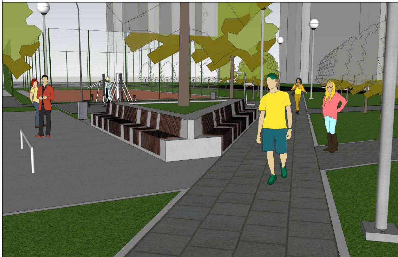
wizualizacja miejsca spotkań